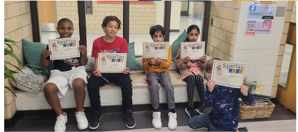
Congratulations to this week SPARTAN's of the week. Keep up the good work!