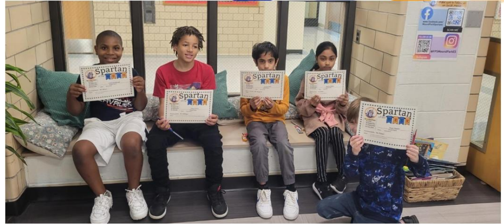
Felicitaciones a los SPARTAN de la semana de esta semana. ¡Sigán con el buen trabajo!

Número de invitados que asistirán- _____